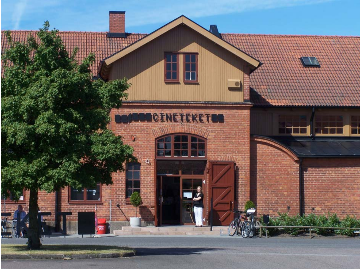
Im 2007 gegründeten Filmmuseum, der Cinetek am Elis Nilsson väg im Regimentsviertel, dürfen die Besucher einen Blick hinter die Filmkulissen werfen.