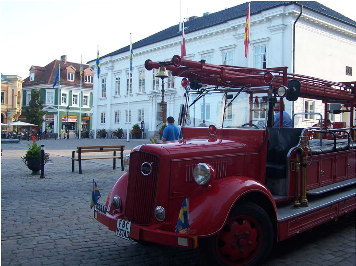
Auf Ystads Marktplatz, dem Stortorget, beginnen alle Wallander-Touren, ob zu Fuß oder – wie hier im Bild – mit einem alten Feuerwehrauto.