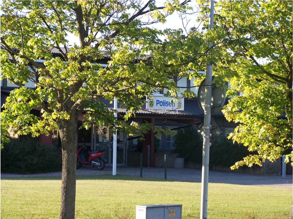
Das – reale – Polizeipräsidium von Ystad, Kurts zweites Zuhause.