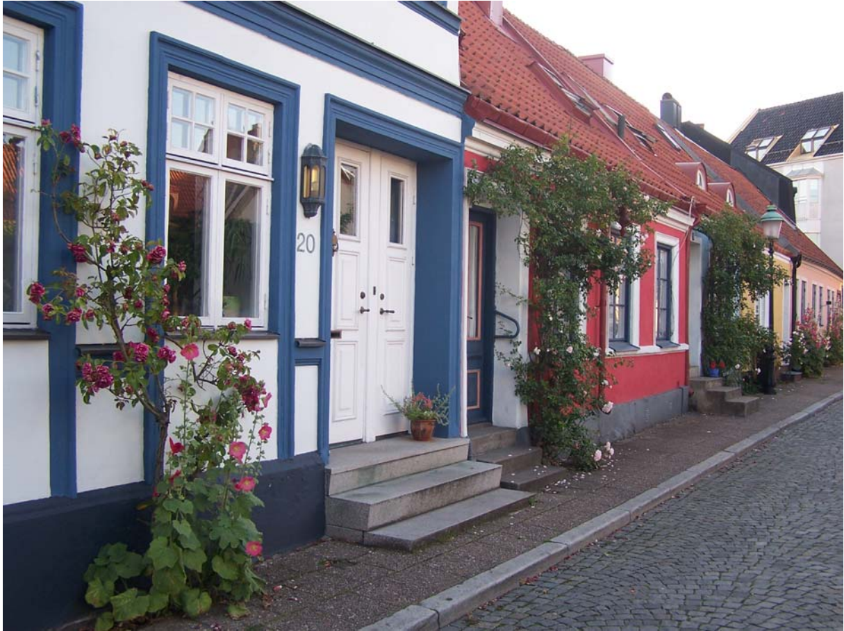
Ystad-Idylle und ...