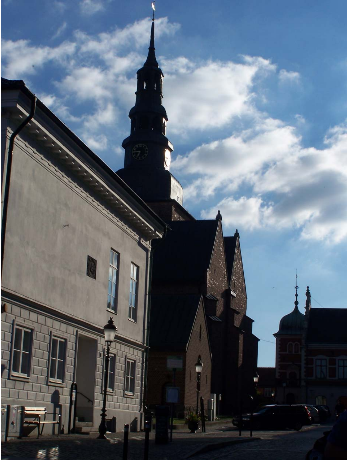
„Um zwei Uhr war die Sankta-Maria-Kirche am Stortorget gefüllt.“ (Henning Mankell, Mittsommermord, Paul Zsolnay Verlag Wien, 2000: S. 491)